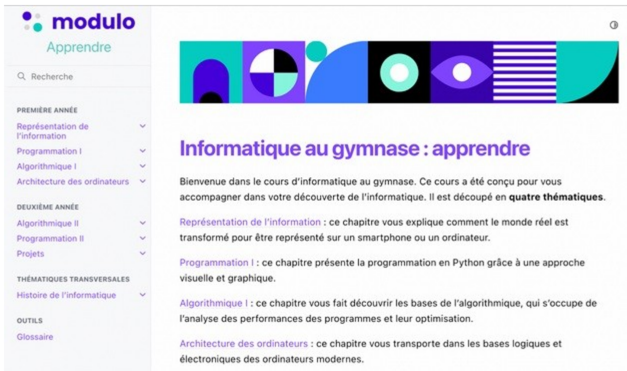
Figure 2: page d'accueil de la partie "Apprendre" destinée aux élèves.